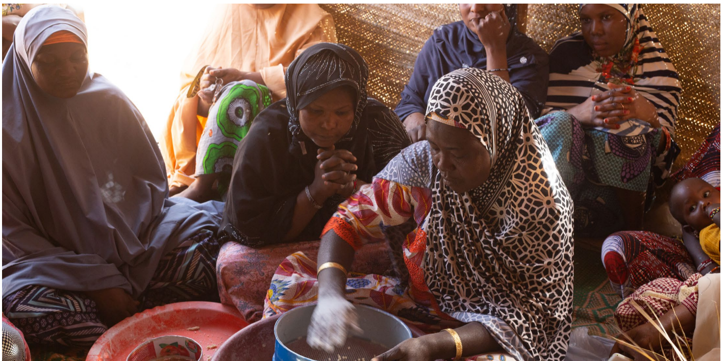
Femmes transformatrices de produits agro-alimentaires de la commune d'Agadez

des poules vivantes à Agadez se fait 2 fois par semaine en raison de 500 sujets par approvisionnement, soit 1 000 sujets par semaine, une quantité qui peine à couvrir la demande » explique le volailler qui y a vu une opportunité afin de développer son marché. Ce reflex ne lui aurait pas été possible sans l'accompagnement du CIPMEN a-t-il confié.