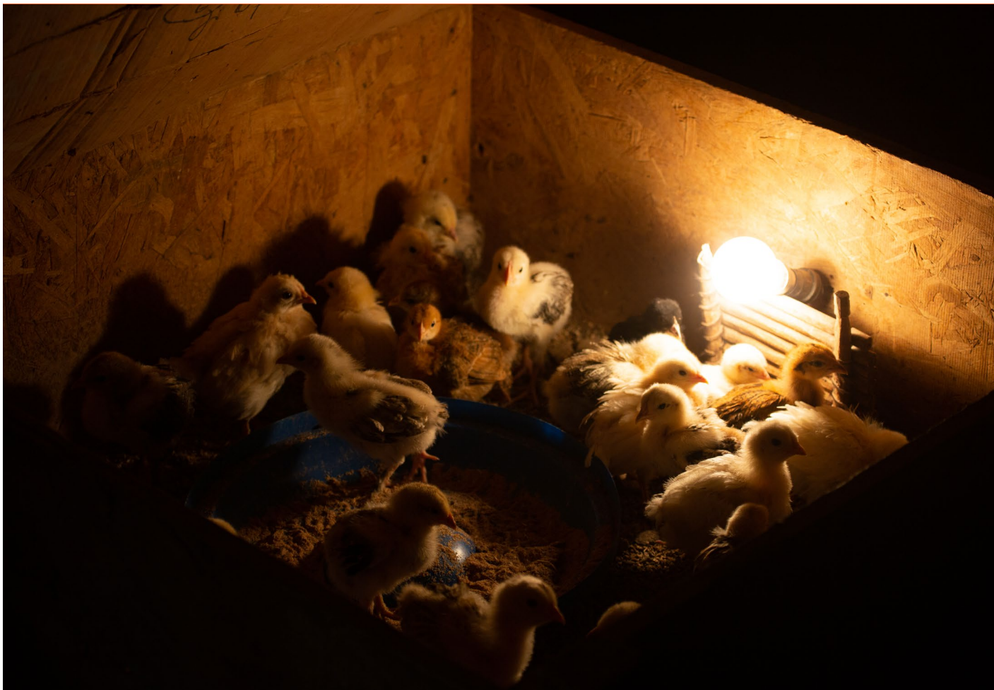
Les poussins de la ferme avicole

Située sur les routes de transit des migrants vers le Maghreb et l'Europe, les départements de Tchirozerine et Aderbissinat dans la région d'Agadez bénéficient depuis 2019 du programme « Durabilité de l'Environnement et Stabilisation Économique sur la Route de Transit » (D.E.S.E.R.T) financé par le Fonds Fiduciaire d'Urgence (FFU) de l'Union européenne pour l'Afrique avec une enveloppe de 13.790.000 € soit environ 9,04 milliards de francs CFA. Le FFU vise à adresser les causes profondes de la migration irrégulière et des déplacements forcés en soutenant, entre autres, les opportunités économiques, la résilience des communautés, la gestion des flux migratoires et lss gouvernance. A travers un volet dédié à l'entrepreneuriat, ce programme est en train de booster la croissance des petites et moyennes entreprises dans les communes d'Agadez, Aderbissinat, Tchirozerine et Dabaga.